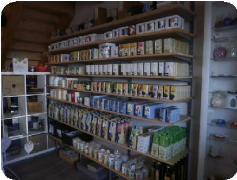
Tee & Gewürze der Fa. Sonnentor . . .