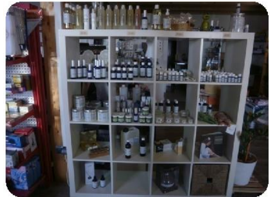
reine ätherische Öle der Firma feeling aus Vorarlberg